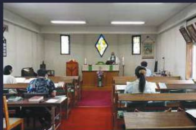
▲ 現在の平取聖公会礼拝の様子(2021年撮影)