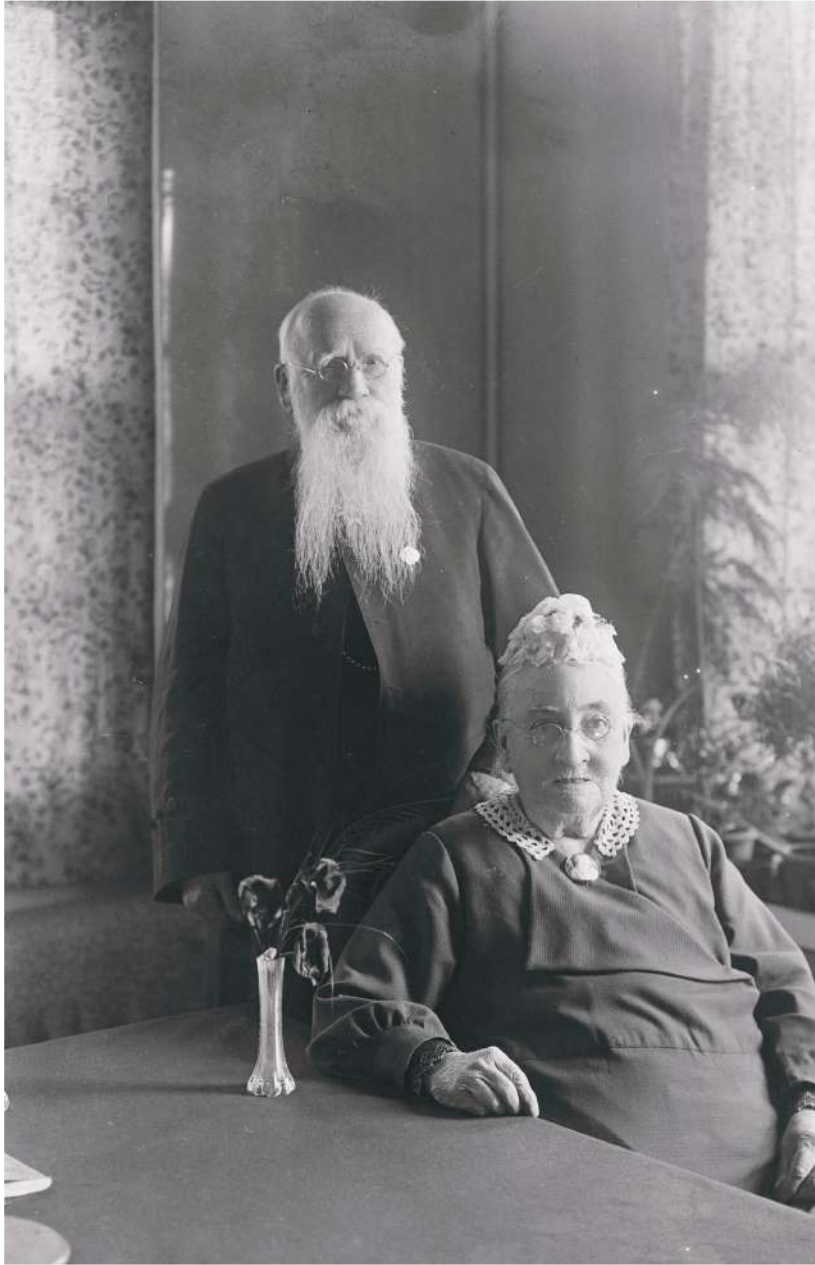
▲ 晩年のバチラー夫妻